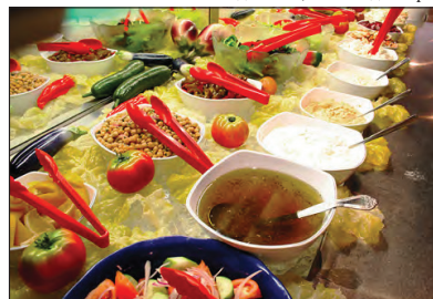
Наред с традиционните за нашия регион шишчета и кебапчета, The Big Fat Greek Buffet предлага безброй изкушения и за вегетарианците. Зеленчуците на грил са просто неустойими.

Дали в The Big Fat Greek Buffet чупят чинии, спазвайки традицията от гръцките таверни? Само по случайност, смес се Мария.